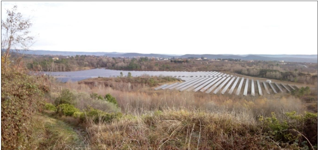
Centrale solaire de Largentière (Ardèche). Puissance crête 12 MW.