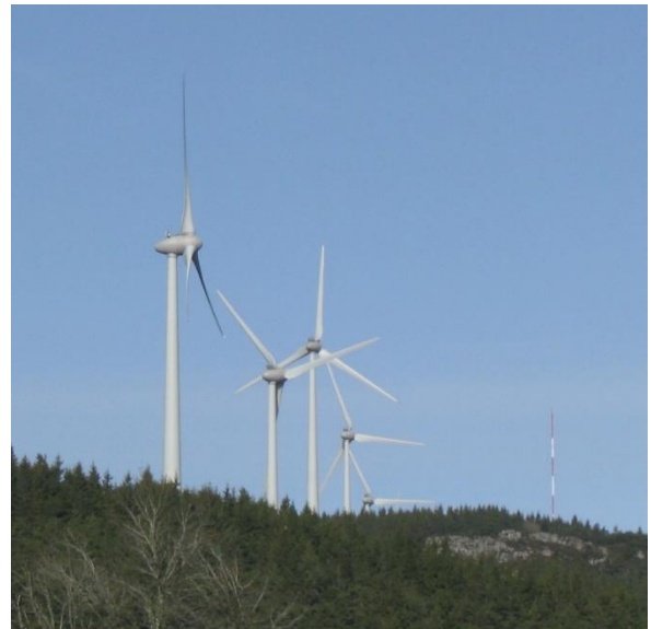
Eoliennes près de Sées (Calvados) Photos J-MT 2021