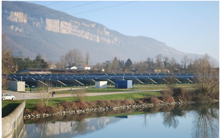
Centrale solaire de Villebois (Ain). Puissance crête 3.6 MW